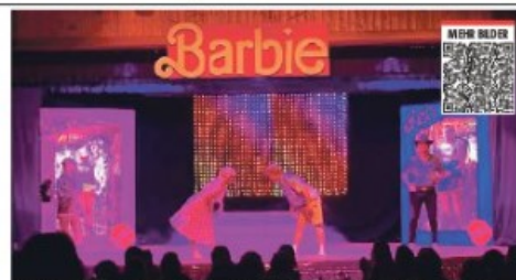
Die Abende standen unter dem Motto „Barbie“ – alle mitwirkenden Damen verkörperten sie, alle Männer wurden zu Kens.