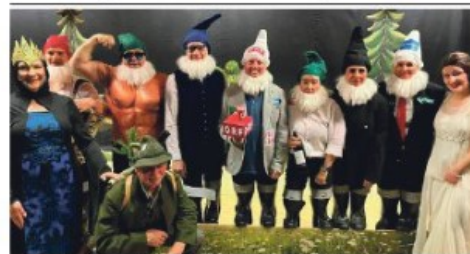
Schneewittchen und die sieben Zwerge tauschten sich gemeinsam mit Arnie Schwarzenegger über die Dorfpolitik aus.

lichen Raumordnungskonzepts ist abgeschlossen und wurde in der jüngsten Gemeinderatssitzung beschlossen. Das gesamte Prozedere hat viele Jahre in Anspruch genommen. Nun aber liegt die gesetzliche Grundlage für die nächsten zehn Jahre wieder vor.