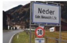
Achtung: Neue 30er-Zonen in Neder und Neustift-Dorf!

Ausnahme des Teilstücks auf der Stubaitalbundesstraße – und den Abschnitt vom Vinzenzheim bis zum Hotel Fernau wurden neue 30er-Zonen verhängt. * Der momentan noch vorherrschende Widmungstopp sollte demnächst aufgehoben werden. Die Fortschreibung des ört-