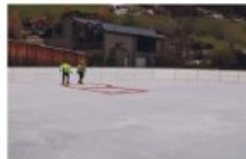
Der Eislaufplatz beim Pavillon soll dieser Tage in Betrieb gehen.

* Für den Eislaufplatz beim Pavillon wurde mit Unterstützung des TVB-Ortsausschusses Neustift eine neue Maschine gekauft. Auch der Platz steht schon und soll dieser Tage in Betrieb gehen. * Der Post Partner wechselte in die Scheibe, in ein Lokal von Manfred Ferchl. Öffnungszeiten: Montag bis Freitag, 13 bis 17 Uhr. * Das neue Hotel der Explorer-Kette in Neder ist eröffnet und in Betrieb. Gegen Ende der Bau-